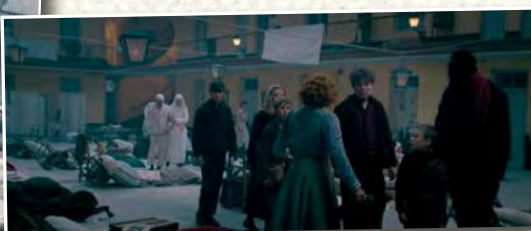
Le pavillon central pendant la guerre et vu par Yann Samuell