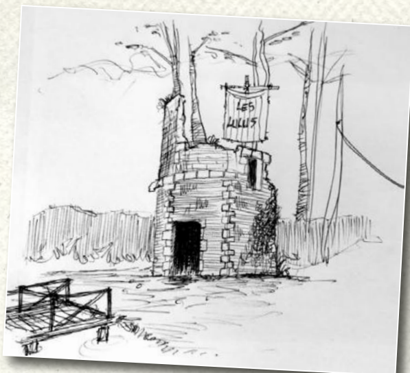
Doc 1 : la cabane des Lulus vue par Hérald Najar

3) Montre, en t'aidant des éléments du tournage, que le film La Guerre des Lulus est une adaptation.