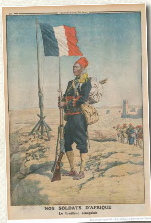
« Nos soldats d'Afrique. Le tirailleur sénégalais » Le Petit Journal, 16 mars 1913

Document à compléter avec une carte des empires coloniaux en 1914 (manuel de l'élève ou sur Internet) https://gallica.bnf.fr/ark:/12148/bpt6k7170522/f8.item