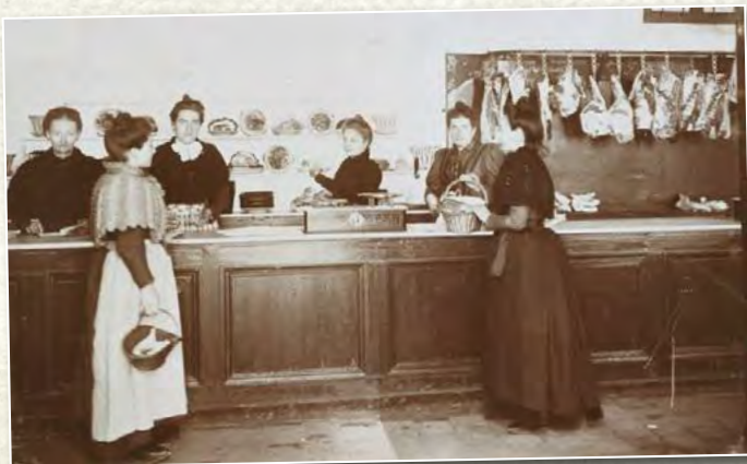
La boucherie du Familistère. Le comptoir de la boucherie des économats, anonyme vers 1901. Coll. Familistère de Guise

1924 : Achèvement de la reconstruction de l'usine de Guise et de l'aile gauche du Familistère.