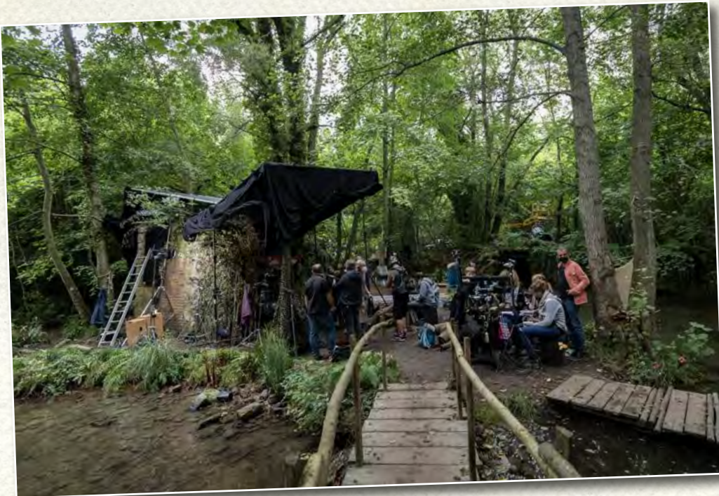
Doc 4 : La cabane des Lulus lors du tournage

Doc 3 : La cabane des Lulus, vue par le scénariste Yann Samuel, Page 19 du scénario