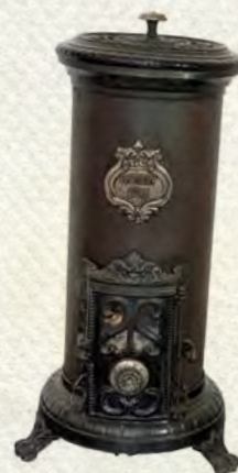
Le « Petit Godin », gamme apparue à partir des années 1890, adapté après 1918 pour chauffer le bois. Coll. Familistère de Guise