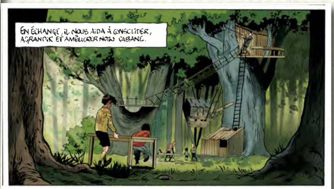
Doc 2 : La cabane des Lulus vue par Hardoc et Hautière ( La guerre des Lulus , Tome 2, Hans, page 14)